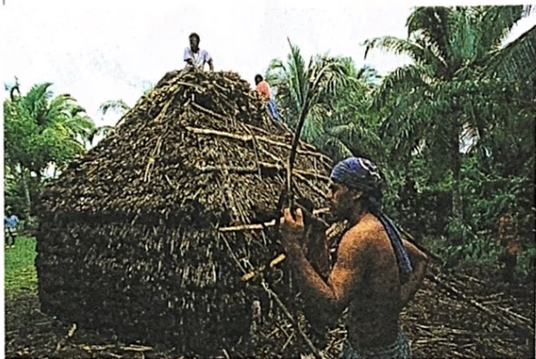
Construction d'une case pour les invités, avant une fête de pilou-pilou.

EN NOUVELLE-CALÉDONIE , une grande fête est organisée chaque année pour célébrer la saison de l' igname* . Cette fête, appelée le pilou-pilou* , se prépare pendant des mois : les hommes construisent des cases*