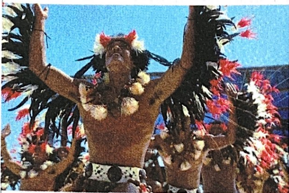
Des danseurs tahitiens, en tenue traditionnelle.

EN POLYNÉSIE FRANÇAISE , sur l'île de Tahiti , les arioi * sont une secte qui se réclame d'un dieu très ancien nommé Oro *, consacré par la mythologie locale comme le